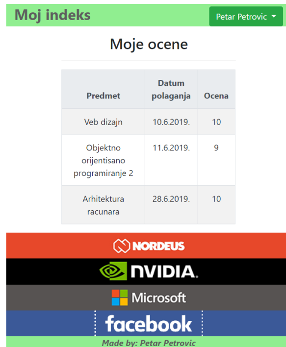
Izgled stranice na uređajima sa malim ekranom

Korišćene boje: #e7482a – Nordeus, #000000 – Nvidia, #575352 – Microsoft, #3b5998 – Facebook, lightgreen – header/footer pozadina, #5e5e5e – header/footer tekst